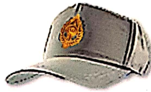
หมวกแก๊ปทรงอ่อน แบบ ๒ (ชาย)