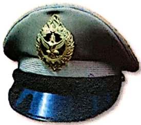
หมวกทรงหม้อตาล แบบ ๑ (ชาย)