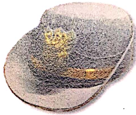
หมวกแก๊ปทรงอ่อนพับปีก (หญิง)